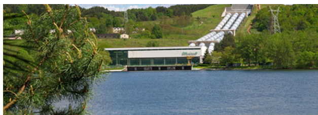
Rys. 6. Elektrownia wodna Żydowo. Źródło: [4] Fig. 6. Żydowo hydroelectric power plant. Source: [4]