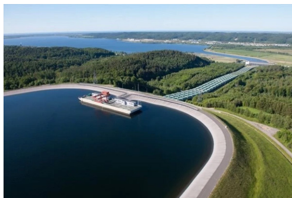
Rys. 3. Elektrownia Żarnowiec. Źródło: [11]