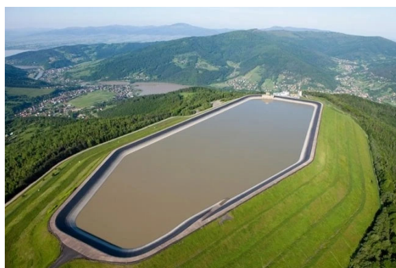
Rys. 4. Zbiornik górny elektrowni Porąbka-Żar.