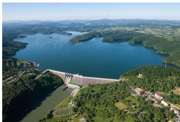
Rys. 5. Elektrownia wodna Solina. Fig. 5. Solina hydroelectric power plant.

(PGE S.A.) [7]. Elektrownia ta zlokalizowana jest w Czymbornowie nad Jeziorem Żarnowieckim w województwie pomorskim na granicy powiatów puckiego i wejherowskiego. Posiada moc zainstalowaną 716 MW (4 turbiny o mocy 179 MW każda). Zbiornikiem dolnym jest Jezioro Żarnowieckie, natomiast zbiornik górny jest całkowicie sztucznym zbiornikiem wybudowanym na płaskim szczycie najwyższego ze znajdujących się w pobliżu jeziora wzgórz morenowych. Pierwsze prace przygotowawcze rozpoczęto w 1972 roku, a uruchomienie elektrowni nastąpiło w 1983 roku [17]. Na rys. 3 przedstawiono widok elektrowni Żarnowiec z lotu ptaka.